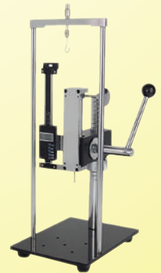
รุ่น EST-500 พร้อมสเกล (ESC-D)

แทนทดสอบแบบแมนนวล EST-500 สามารถใช้ร่วมกับเกจวัดแรงดึงและแรงกด สำหรับวัดแรงกด-แรงดึง โคอัล, สไลด์ การทดสอบความแข็งแรง การทดสอบการทำลายล้าง และอื่น ๆ