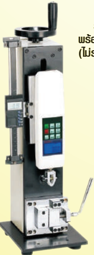
รุ่น ESL-500 พร้อมสเกล (ESC-D) (ไม่รวม EH/EN เกจ)